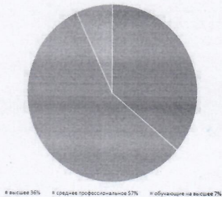
Уровень образования педагогических работников